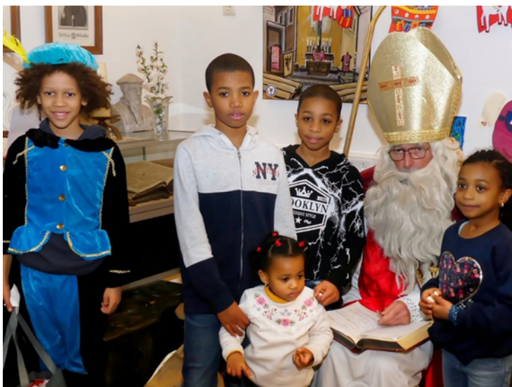
De Sint komt ook voor jou