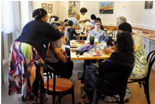
Burendag GSM 2023

De bijeenkomsten vinden plaats bij de mensen thuis. Daarnaast worden laagdrempelige groepsactiviteiten georganiseerd, waarbij mensen van de doelgroep zelf sleutelfiguren zijn. De vrijwilligers die de activiteiten coördineren, hebben een bijzondere deskundigheid. Ze steunen kwetsbare buurtbewoners en helpen mensen door ze met elkaar te verbinden. Wijkpresentie houdt met de vrijwilligsters 10 keer per jaar voortgangsgesprekken waarbij steeds ook signalering een agendapunt is.