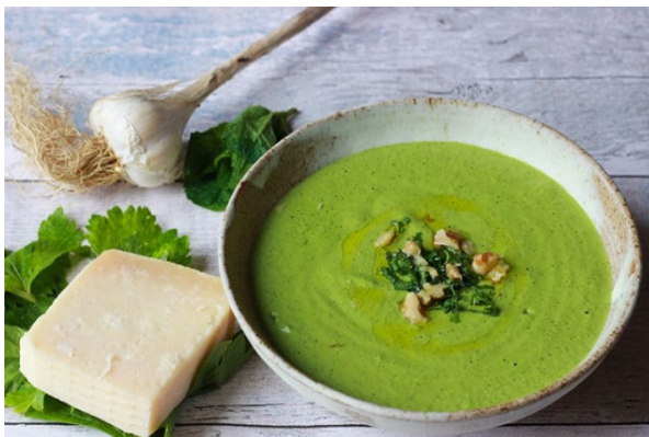
Koken voor elkaar