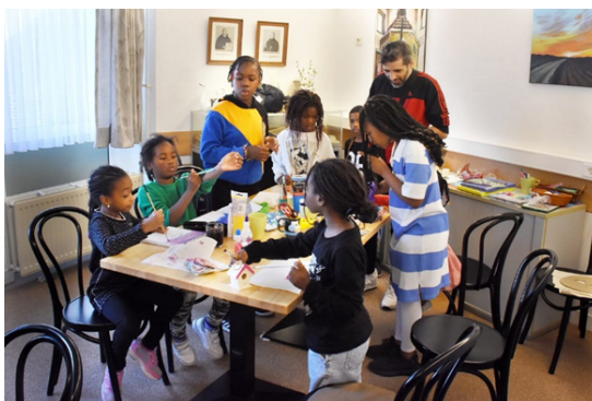
Burendag GSM 2023