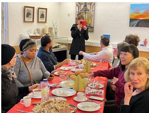
De Kerstlunch mag niet ontbreken

Positieve gezondheid: https://www.iph.nl/over-machteld-huber/