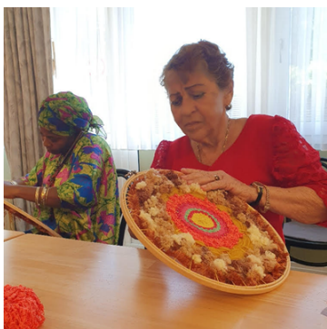
Alles begint met de kunst creatief te zijn

Daarnaast berichten wij hoe presentiewerk gepraktiseerd wordt in het Inloophuis OP DE HOEK door de samenwerkende partners.