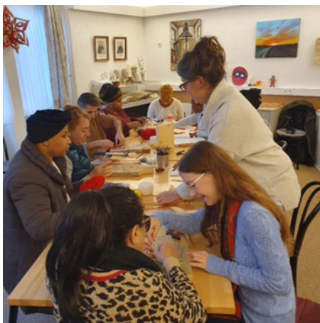
Samen doen stimuleert

Respect, verdraagzaamheid, rechtvaardigheid, gelijkheid, vriendelijkheid, liefde, veiligheid, vrijheid, vertrouwen en eerlijkheid. Daarbij zijn wij geïnspireerd door het principe voortvloeiend uit ons christelijk cultureel erfgoed: 'Je naaste een naaste zijn'.