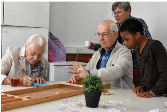
Burendag GSM 2023